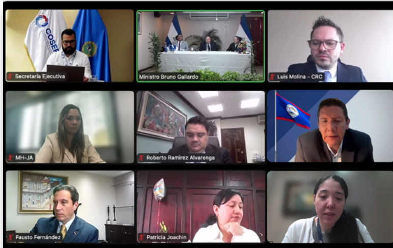
Ministro de Finanzas, Desarrollo Económico e Inversiones de Belice, Christopher Coye manifestando la intención de Belice para incorporarse al COSEFIN durante la LIV reunión ordinaria del COSEFIN

Uno de los hitos más importantes de 2024 fue la incorporación de Belice como miembro pleno del Consejo de Ministros de Hacienda o Finanzas de Centroamérica, Panamá y República Dominicana (COSEFIN), consolidando así la integración regional en materia de finanzas públicas.