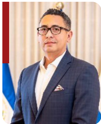
Jerson Posada Ministro de Hacienda El Salvador

Máster en Economía con énfasis en Economía Empresarial, de la Universidad de Costa Rica.