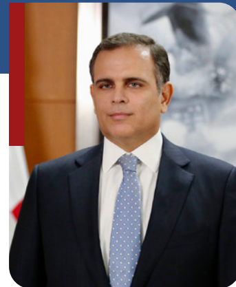
Jochi Vicente Ministro de Hacienda de República Dominicana

Licenciado en Economía de la Universidad de Panamá, tiene una maestría y es candidato a Doctor en Filosofía de la Economía por la Universidad de Chicago. Fue Ministro de Economía y Finanzas entre 2007 y 2009 y elegido como Ministro de Finanzas de las Américas por la revista The Banker del Financial Times en 2008.