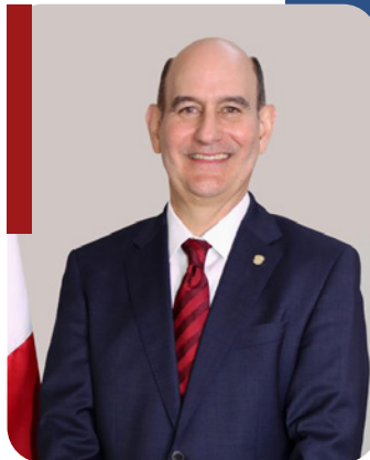
Felipe Chapman Ministro de Economía y Finanzas de Panamá

Ministro de Hacienda desde junio de 2024 y miembro del Consejo del Banco Central. Con doctorado en Derecho, se especializó en Penal y Alta Gerencia. Desde 2007, ha ocupado cargos clave en Hacienda, como Viceministro y Director de Contrataciones del Estado.