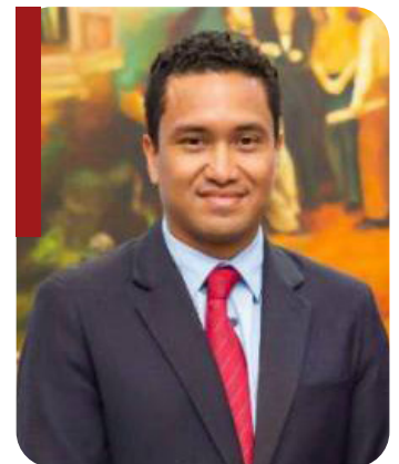
Christian Duarte Secretario de Finanzas Honduras

Especialista en finanzas públicas y economía con 25 años de experiencia, contribuyó significativamente en el Instituto Centroamericano de Estudios Fiscales y colaboró con el Banco de Guatemala y la Comisión Económica para América Latina y el Caribe.