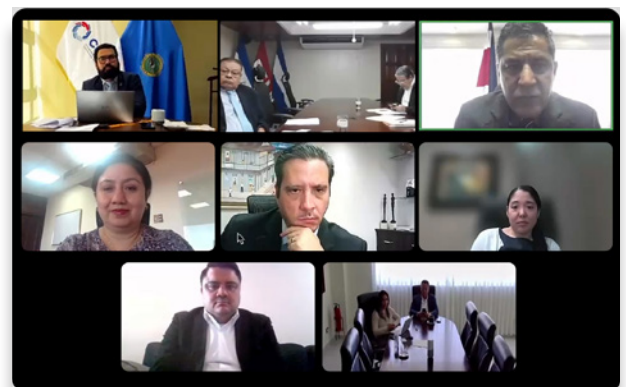
Votación por la incorporación de Belice al COSEFIN durante la LV reunión ordinaria del COSEFIN

La incorporación de Belice como miembro pleno no solo fortalece a nuestra región, sino que nos recuerda que, a través de la colaboración, la perseverancia y la visión compartida, es posible alcanzar metas que beneficien a todas nuestras naciones.