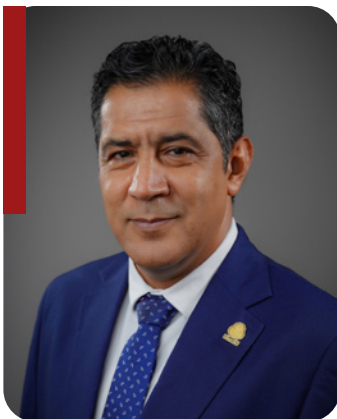
Nogui Acosta Ministro de Hacienda Costa Rica

Licenciado en Economía con Énfasis en Administración de Negocios, de la Universidad de Costa Rica.