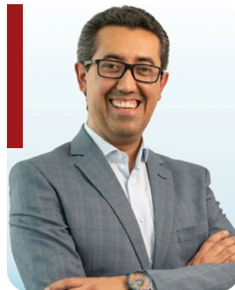
Jonathan Menkos Ministro de Finanzas Guatemala

Cuenta con una destacada carrera en economía y finanzas, desempeñó varios roles clave en el Ministerio de Hacienda de El Salvador, culminando con su nombramiento como Ministro de Hacienda en julio de 2023.